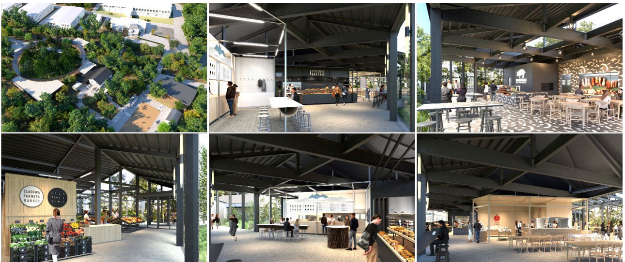
※上記画像は、2024年秋グランドオープン予定エリアのイメージ画像です。

「くらすわの森」は、レストランやハム・ソーセージ工房、マルシェ、菓子工房、ベーカリー&カフェ、ショップが集い、おいしい体験、たのしい体験、すこやかな体験を通して“すこやかさ”を提供する施設です。