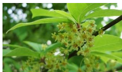
春には花を咲かせます

クロモジは、日本の山地に自生するクスノキ科の落葉低木で、枝葉により香りがあるため、山地の人々や登山愛好家に親しまれてきた植物です。樹皮にある黒い斑点を文字に見立て、クロモジ(黒文字)という名前が付けられたといわれます。古くから皮付きのまま削って楊枝として使われ、今では和菓子に添えられる高級楊枝として知られています。