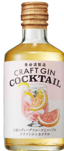
クラフトジンカクテル