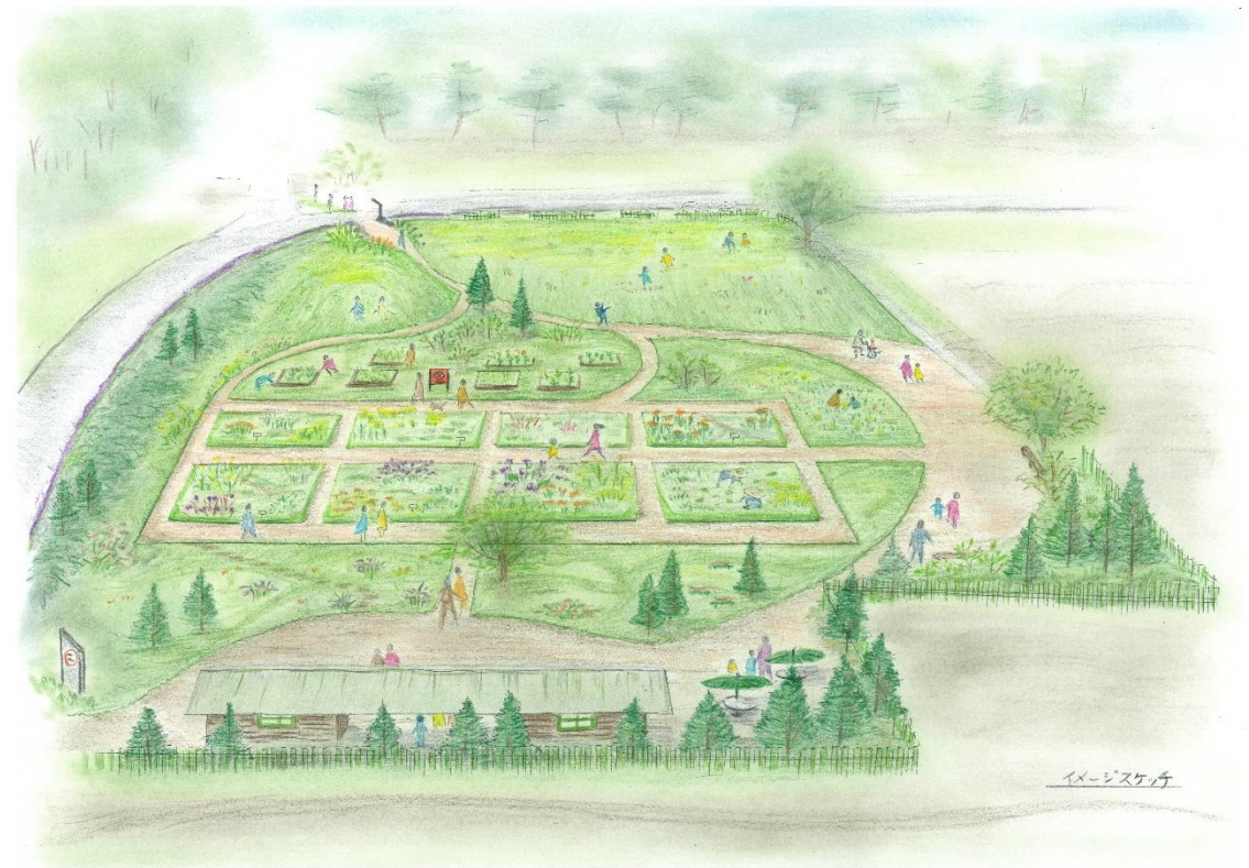
養命酒ハーブの庭 イメージスケッチ