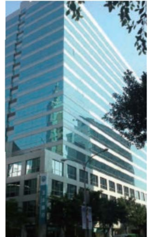
支店の入居するオフィスビル