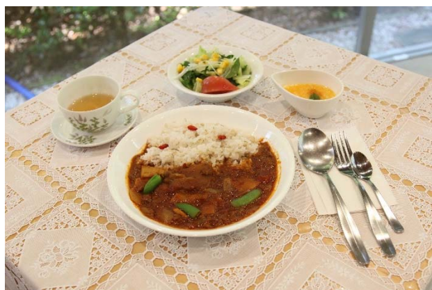
「春のたけのこ薬膳カレー」